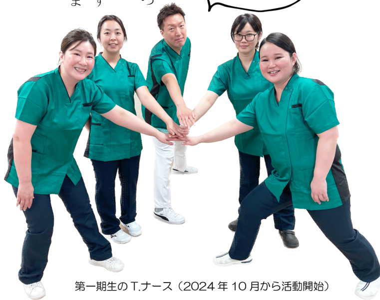
第一期生のT・ナース（2024年10月から活動開始）